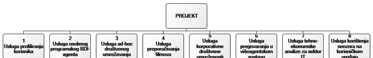
Slika 12.1. WBS projekta

Na Slici 12.1. prikazana je struktura raspodijeljenog posla za projekt.